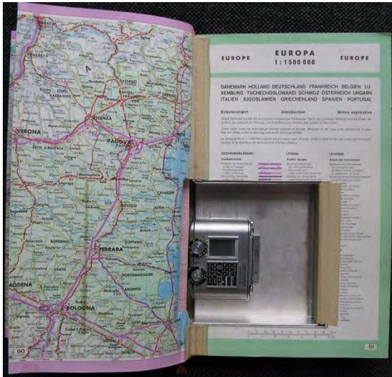
Atlas mit eingebauter Tessina-Kamera

Einbaumittel (1960+) Gegenstand, in welchem ein Gerät (Foto, Funk, Mikrofon und dergleichen) so verborgen wird, dass es unauffällig betätigt werden kann.