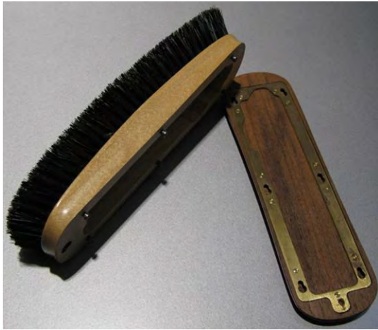
Verbringungsmittel Kleiderbürste

Vernehmung (1950+) Methode der Nachrichtenbeschaffung durch Befragung von Personen über interessierende Vorgänge und Objekte.